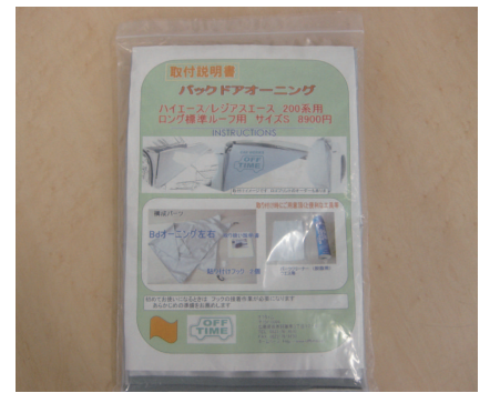
取扱いやすさと、コンパクトな収納性を考慮し、構成部品は金物を使わず、被服ゴム輪やプラスチックを採用しました。